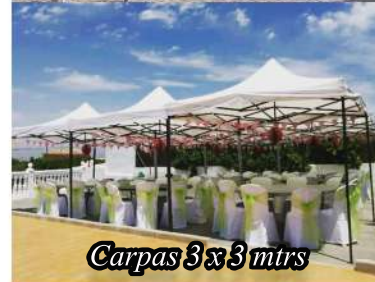
Carpas 3x3 mtrs