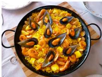
Paellas mixta, de carne o solo marisco