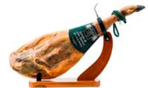
Cortador de Jamón