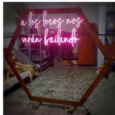
Neón + Hexágono