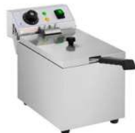
Freidora 8 L