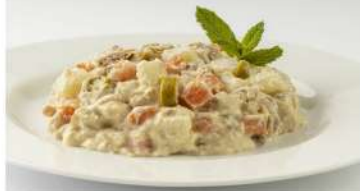
Raciones de comida casera (Hacemos menús junto con las paellas)