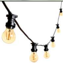
Guirnalda de Bombillas