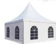
Jaima 5 x 5 mtrs