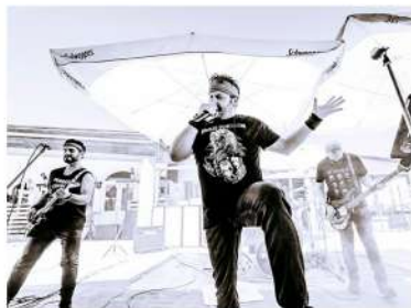
Bandas de música de cualquier estilo