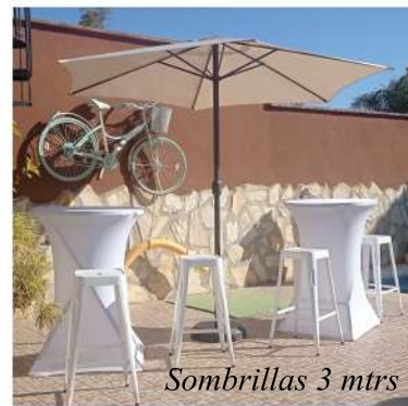
Sombrillas 3 mtrs