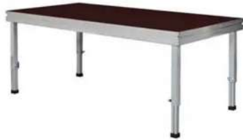
Tarimas de escenarios