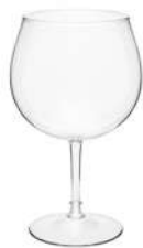
Copa Balón 62 cl