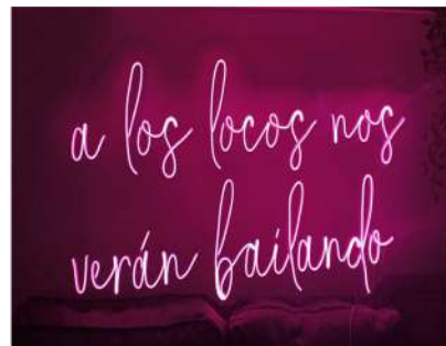
Neón 1,50mtrs x 0,90 cm