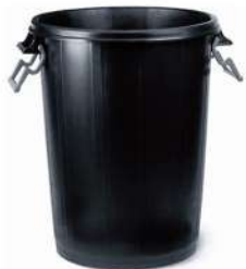
Cubo de basura