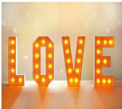
Alquiler Letras LOVE 1 metro