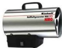
Cañon de calor 10 kw