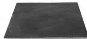
Bandeja Pizarra 30 x 20cm