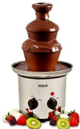
Fuente de Chocolate

NO DEJE DE VISITAR NUESTRA PÁGINA WEB Y NUESTRAS REDES SOCIALES