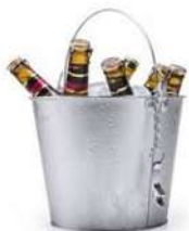
Cubo Metal Cervezas