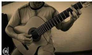
Guitarrista clásico, Violinista, Pianista, etc...