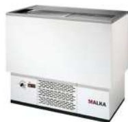
Botellero 1 Mtr