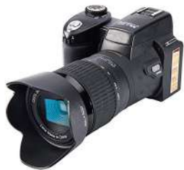
Fotógrafo de Bodas