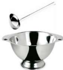
Sopera y Cazo