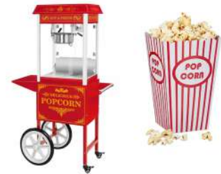
Carrito de Palomitas