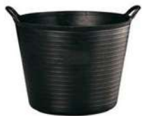
Barreño o espuelas