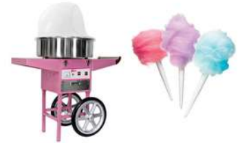
Carrito de Algodón de Azúcar