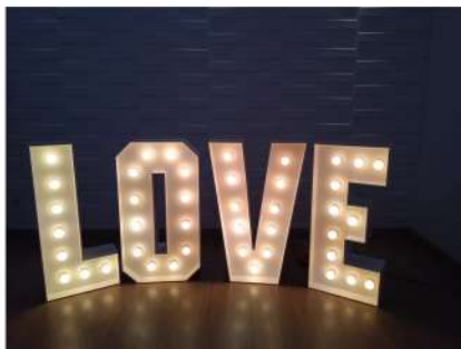
Alquiler Letras LOVE 1,20 metros