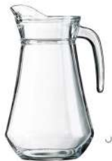
Jarra de cerveza 1 L