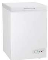
Congelador 100 L